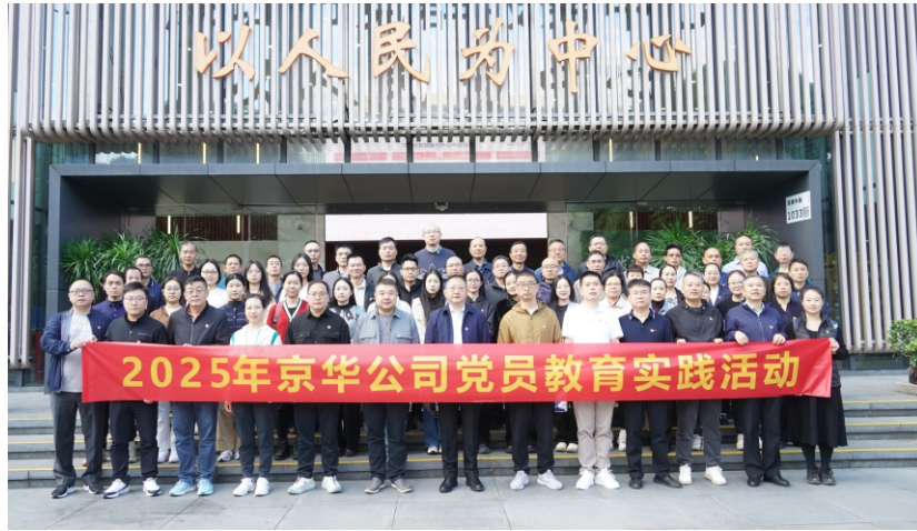
司今后进一步加强党建工作、推动党业深度融合提供了宝贵的借鉴范本。随后，党员们前往土洋东江纵

在深圳市党群服务中心的报告厅，党员们通过观看纪录片等形式，重点学习了深圳在推动党业深度融合方面的创新举措与先进经验。大家纷纷表示，中心的党业融合模式思路清晰、举措务实，为公